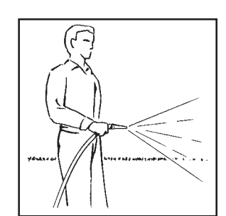
Water in after application.