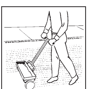
Overlap previous wheel track slightly, as shown, to avoid gaps in coverage.