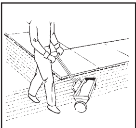
Close the spreader when you stop walking or make turns to avoid uneven coverage.