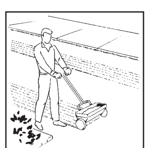
Begin spreading by laying down two strips of this product at each end of lawn. Fill in remaining area as shown here.

If you are not satisfied with the performance of this product, simply send your name, address, and proof of purchase to the address shown and we will be happy to refund your money.